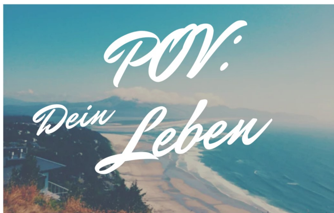
FIRMUNG 2024 IN DER PFARREI ST. NIKOLAUS WESEL